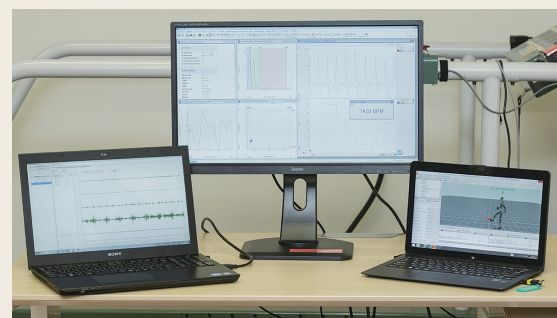
図3 計測・解析ソフトウェア画面 （左から筋電計、脈波計、全身モーションキャプチャ）

図3は、動作（全身モーションキャプチャ）、筋電図（筋電計）、脈波（脈波計）の同期計測例です。具体的には、筋電図による筋活動部位の同定や筋活動の程度（左モニタ）の解明、脈波計測による心拍数（中央モニタ）の取得、慣性センサ式モーションキャプチャによる運動学パラメータ（右モニタ）の取得をリアルタイムに行います。標準のパッケージソフトウェアにより容易に解析が可能で、サポーターやスポーツウェアなど生活関連製品の効果検証や新たな人間特性解明による新製品開発が可能となります。