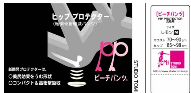
図7. パッケージラベル(左)とサイズ表記タグ(右)

製品開発と並行して販売に向け、「ピーチパンツ」とネーミングし商標登録を申請した。その他、パッケージ、下げ札等のデザイン(図7)、商品パンフレット、ウェブコンテンツ作成等の支援を行った。製品は18年4月末から販売を開始し、マスコミ等にも取り上げられた。今後ヒッププロテクターの認知度の向上と普及が期待される。