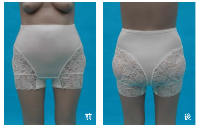
図6. 最終プロトタイプ(商品名:ピーチパンツ)

さらに検討を進めた結果、前打ち合わせのデザインと副資材の面ファスナーが、介護用品を連想させると判断し、パンツ型のデザインに変更し、面ファスナーを廃止した。また失禁に対応するため、市販のパッドが装着できるようクロッチ部の幅を広げた。最終試作品を図6に示す。