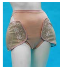
図1. 旧製品 (商品名：生き活きパンツ)

(有)とみの既存製品(図1)は，オムツ型の製品である。この製品に限らず市販の多くのヒッププロテクターは，表1に示す課題がある。それらを解決する方向で表2に示す開発目標を立案した。