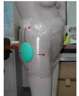
図2. 粘土によるプロテクターの造形

現在市販されているヒッププロテクターは，衝撃吸収方式において外力分散タイプと外力吸収タイプの2種がある。分散タイプは保護効果が高いが，硬い素材を使用するため装着感が悪いという欠点がある。このため本開発では吸収タイプを採用することとした。腰部にフィットする形状とするため，人台上で粘土による型取りを行った。その際，付加機能としてヒップラインの補正機能(美尻効果)が得られるような形状を検討した(図2)。