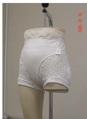
図5. ファーストサンプル

既存のヒッププロテクターの介護用品然としたデザインから脱却を図るため、通常のおしゃれな下着のデザイン等も参考にしながら検討した。脚部をレース生地で切り替えフェミニンな感覚とし、且つ通気性を考慮した。また、ウエスト部に生地の耳を使用し、ゴムの無いデザインを採用し、締め付け感を軽減した(図5)。