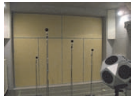
図1. 音響透過損失測定（試験室内部）