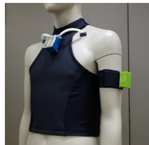
開発したパーソナルトレーナー スーツの着用時外観