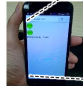
その場でスマートフォンにアドバイスを表示し、 正しいフォーム、テンポを維持し続けられるよう支援