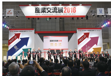
産業交流展 2016の様子

募集開始：6月上旬(予定) 対象：首都圏(東京都・埼玉県・千葉県・神奈川県) に事業所を有し、情報、環境、医療・福祉、 機械・金属のいずれかの分野に属する中小 企業・団体など 出展料：詳細は産業交流展公式HPをご確認ください。