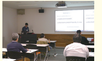
技術セミナー：講義のみ 講習会：講義と実習で構成