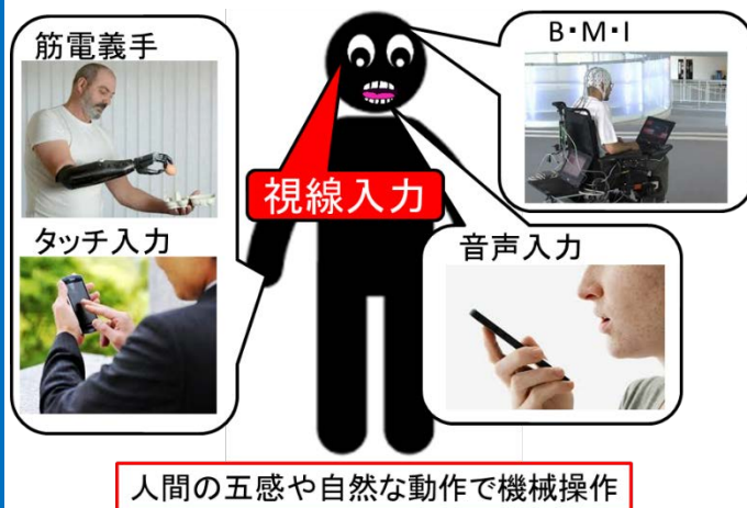
図 1. ナチュラル UI の発展・普及