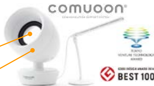
図1. 製品化した難聴者向けスピーカシステム

開発品は従来のコーンスピーカシステムと比べて明瞭度が向上し、中等度の難聴者でも音声聴取が可能であることを確認しました。