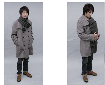
図5. ダッカーとして着用時 とマフラーとして着用時

伸縮素材のニット生地でダッカーを提案することにより、「たて抱き」、「腰抱き」の抱き方の違いによるウエスト部分の周長の変化(15cm)に対応できるコートを開発した(図5)。既製品は、ダッカー単体ではリユース方法がないため不要品となっていたが、本研究ではマフラーとして使用することが可能となり、着用者の利便性が向上した。これらを新たなダッカーとコートとして、特許出願を行った（特願 2012-181879）。