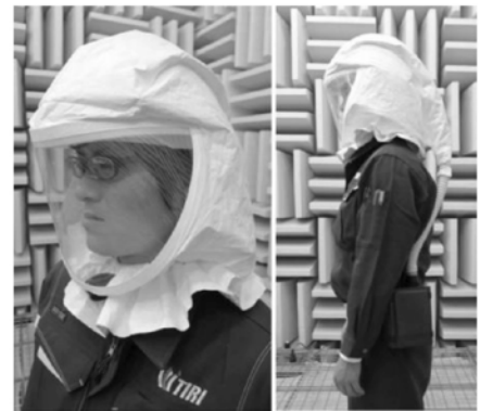
図1. 開発したPAPR用フード