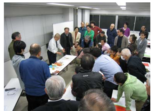
図2 産地情報セミナー