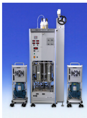
図1 環境測定システム

本研究は、東京都地域結集型研究開発プログラムによる支援を受けて実施しています。記して感謝の意を表します。