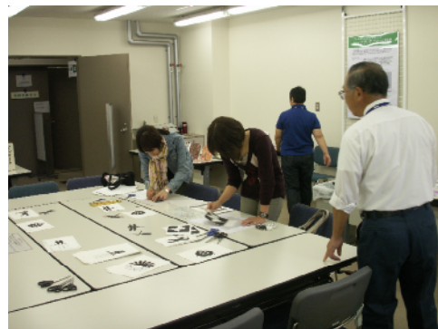
熱転写プリントの体験 (墨田支所)