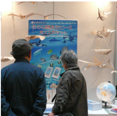
ECO経木モバイル (城東支所)