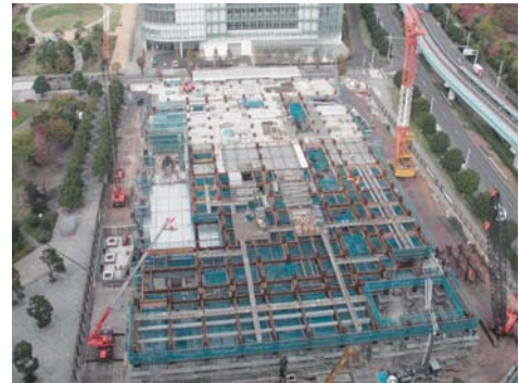
図3 新本部現場建築工事状況