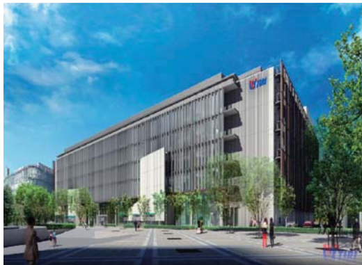
図1 新本部完成イメージ

現在1階柱壁、2階床にかけての建築工事が進められ、順調に進捗しています（図3）。