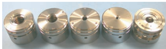
図3 試料ホルダー（内径50×高さ30mm） 左から測定試料径30mm/20mm/10mm/5mm用、マッピング用

試料ホルダー（図3）に入り、真空中で安定であれば、大抵のものが分析できます。X線強度は、測定面積に比例しますが、表面に凹凸があったり、厚みが十分（樹脂1cm以上、酸化物5mm以上）ないと、強度は下がります。小さい試料は並べ、薄い試料は重ねて、X線強度が大きくなるように工夫をします。粉体は、プレスしてペレット状にするのが望ましいのですが、砂のように固まらない試料は、専用の容器に入れてフィルムで覆います。