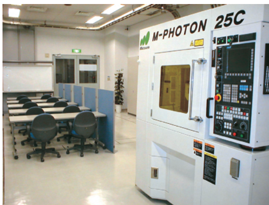
図1 支援センター(発足当時) と金属光造形複合加工機

城南支所では、平成14年度に経済産業省の外郭団体である(財)素材材センターより次世代生産システム研究開発事業の補助を受け、ものづくりIT技術開発・実用化支援事業を実施しています。この支援事業は、地域の金型製造を始めとする金属加工関連産業の技術の高度化と生産力の強化を狙いとしたものです。事業の中では「ものづくりIT技術開発・実用化支援センター(以下支援センターと略す)」の開設(図1)や「金属光造形加工研究会(以下研究会と略す)」を発足させています。