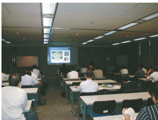
図2 研究会のセミナー風景

支援センターには、全国にもまだ数台しか導入されていない、金属粉を材料に使い積層造形する金属光造形複合加工機を設置しました。研究会(14社31名)では技術セミナー(図2)や勉強会を開催し、この加工機による積層造形技術のデータ蓄積を行い、実用化を目指しています。