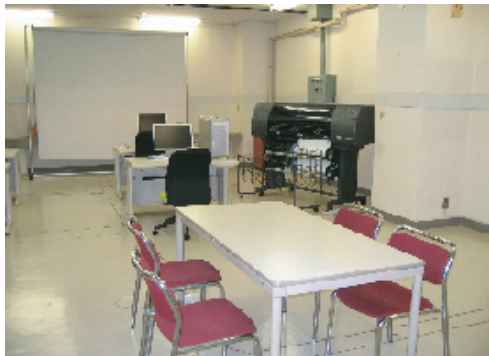
デザイン支援室（グラフィックデザイン）

支援機器のご利用時間：平日（月～金）午前9時から午後8時まで（事前予約が必要です）