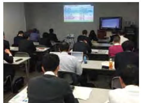
多摩テクノプラザでの遠隔セミナー