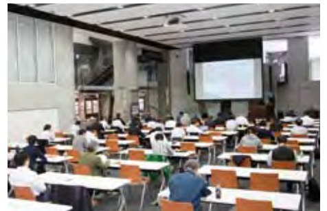
本部開催のセミナー