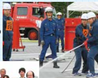
▲放水する自衛消防隊