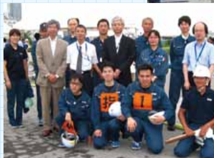
▲都産技研メンバー