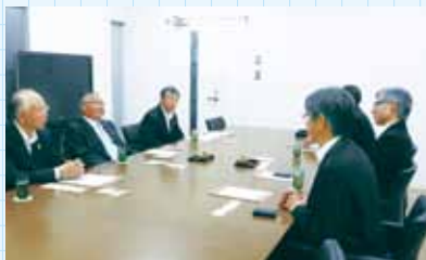
▲理事長室にて終始和やかに執り行われた締結式