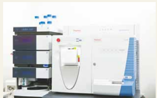
液体クロマトグラフ質量分析装置