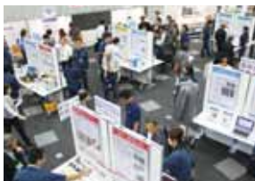
東京イノベーションハブでの展示

東京イノベーションハブ(本部 2階)では、都産技研の研究成果や技術シーズを紹介するパネル展示のほか、都産技研と都内中小企業との共同研究で生まれた製品(ECO経木モバイル木工工作キット・自然素材100%の成形材料サスティモ®を使った新世代漆器「ときうるし」・モバイルプロジェクタースクリーン・三宅ガラスジュエリー)の展示・即売会を行いました。また、1階エントランスでは、次世代自動車技術研究会によるEV車の展示や、多摩テクノプラザで制作した燃料電池駆動電気自動車「エコノムーブ」の展示も行い、多くのお客さまがご覧になりました。