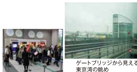
ゲートブリッジから見える東京湾の眺め

都産技研本部の周辺をバスで巡り、東京ゲートブリッジを渡るツアー。あいにくの雨模様にもかかわらず、約180名の方が参加されました。