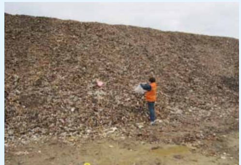
震災で発生した大量の廃棄材

既存の塩素濃度の分析は、分析時間や精度に課題があり、早急な対応が求められる被災地においては不向きでした。そこで、本研究では既存法を最適化し、より短時間かつ高精度な塩素分析法の開発を目的としました。