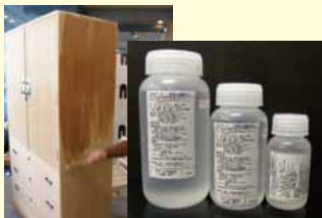
開発した桐たんす用 防カビ剤