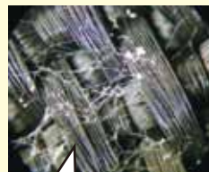
繊維に発生したカビ状の異物