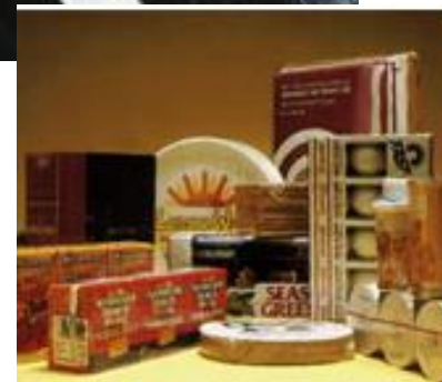
丈夫なポリエチレンフィルム