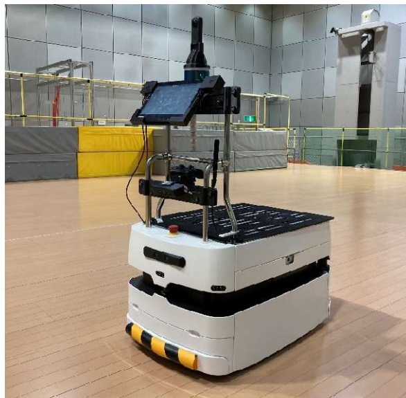
図 1. 供試体の外観