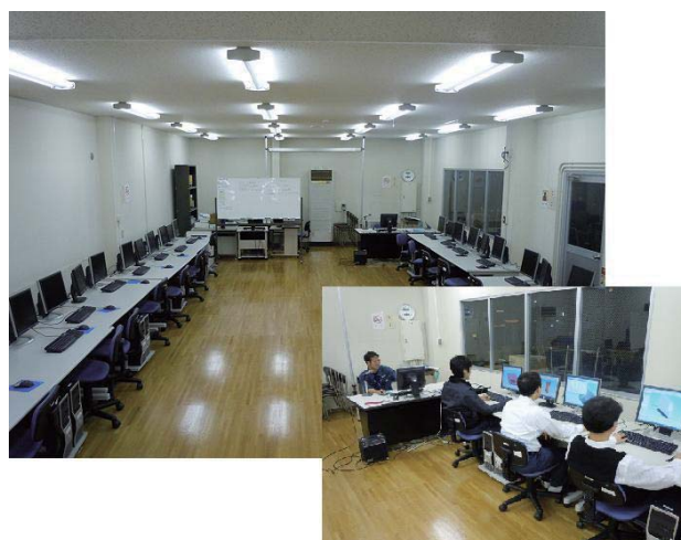
図1 CAD/CAM研修室と講習会の様子

幾つかの研修用ソフトウェアがインストールされております。各講習会は、CAD/CAM研修室を使用し、実際にソフトウェアを操作して頂きながら体験して頂ける内容とさせて頂きました。