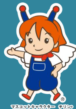
マスコットキャラクター テリノ