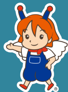
マスコットキャラクター チリン