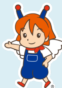
マスコットキャラクター テリン®