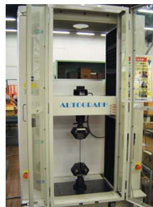
図3 100kN精密万能試験機

金属材料の機械的性質の測定、金属製品の強度の測定を行っています。試験項目は、引張強度、圧縮強度、曲げ強度、ねじり強度、硬さ、疲労強度、ねじ関連の強度等です。