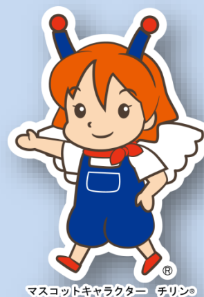
マスコットキャラクター テリン®