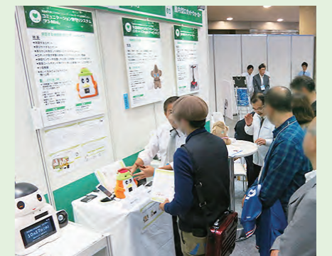
過去に出展したJapan Robot Weekの様子