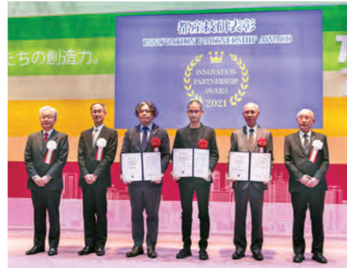
2021年11月に行った都産技研表彰式の様子

都産技研の技術支援・研究開発を通して、社会貢献度の高い事業、製品・技術開発に意欲的に取り組んでいる中小企業を表彰します。