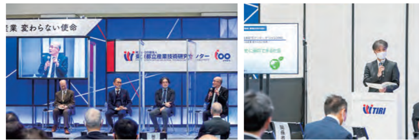
2021年11月に行ったパネルディスカッションの様子

今日では、IoTやAIはビジネスの生産性と品質向上に欠かせない分野です。今回は、都産技研情報システム技術部IoT技術グループ長をモデレーターに、IoT分野で研究開発に取り組む企業さまと、AI・製造業の見える化に精通した学識経験者の方をお招きし、パネルディスカッションを行います。