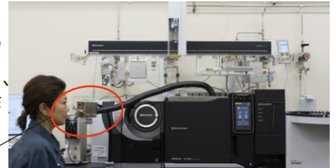
図1 におい分析システム

におい嗅ぎポートから時間の経過とともに放散されるにおいをヒトの嗅覚で確認し、その感じ方（強さや印象）をグラフ化したものです。