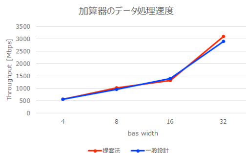
図2 開発手法と従来法（ハードウェア記述言語による設計）を用いて設計した加算器のデータ処理速度の比較