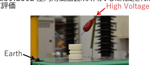
図5 試験セットアップ