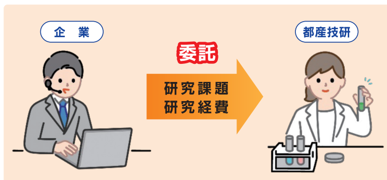
受託研究による製品開発

都内中小企業などからの委託に基づいて、都産技研が短期の研究・調査を行います。随時受付を行っており、企業の研究課題に素早く対応できます。研究費は企業負担となります。