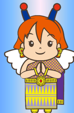
TIRI マスコットキャラクター チリン®