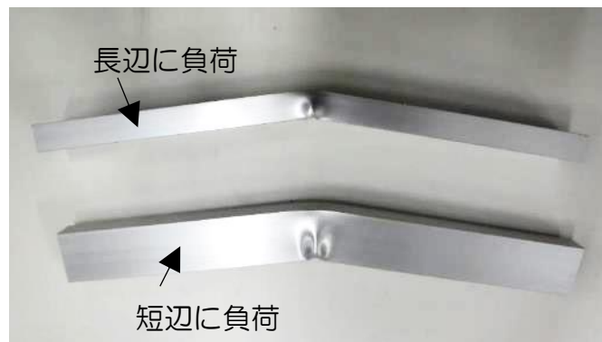
図 3 試験後の様子