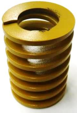
図 1 試験品