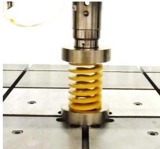
図 2 試験の様子