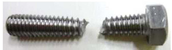
図 3 試験後の様子