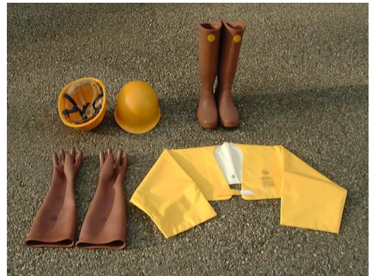
図1 代表的な保護具の一例