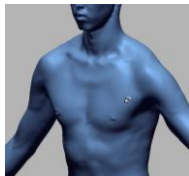
各パーツを繋ぎ目なくマージ