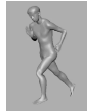
動作データの適用