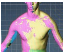
体幹と左右の腕とを個別に形状データ化

私たちは、デジタルアーカイブの文脈において「演者の『身体形状』および『動き方』の両方が唯一性や希少性を備えており、アーカイブズの出発点としての性質を帯びている」ことに気付きました。そこで、形状データおよび動作データを備えた人体のデジタルデータを作成できれば、デジタルアーカイブ技術の発展に寄与しようと発想しました。本研究ではこのアイデアに基づき、動作する人体をデジタル的に復元するプロセスを開発しました。