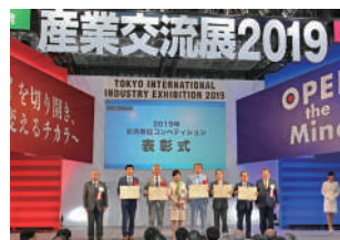
前回(2019年度)の表彰式の様子

都内中小企業がその技術力を活かして新たに開発した「革新的で将来性のある製品・技術、サービス」を表彰するコンテストです。優れた製品・サービスを国内外に発信するため、受賞企業には開発・販売等奨励金を交付し、パンフレットの発刊等による広報活動を行います。