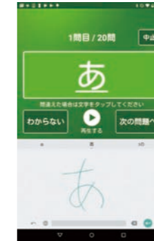
スピーカーから流れる単音節を聴きとり、画面に手書きで入力。