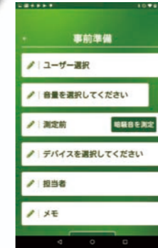
ユーザーや実施条件を選択するだけで、簡単にチェックの準備ができる。