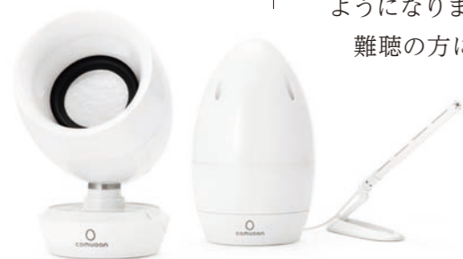
難聴者向けスピーカー「comuoon®(コミュニケーション)」。本アプリと組み合わせて使うことで、検査のみならず認知症予防や聴覚リハビリにも活用可能。

光音技術グループ <本部> TEL03-5530-2580 デザイン技術グループ <本部> TEL03-5530-2180