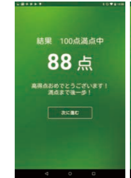
結果を自動採点。子音・母音それぞれの聴こえ方や、聴力の推移を把握できる。