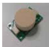
接触センサ (タッチエンス (株) POT-D-SN18X10CN)