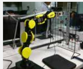
開発に使用したロボットアーム (Robai Corporation Cyton Epsilon 1500)