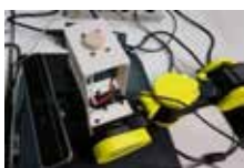
可視光+深度画像カメラ (Intel RealSense F200) と手先の一部