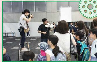
3Dバイオリンゲリラコンサート 3Dプリンタでつくったバイオリン を持った研究員に会おう！ バイオリンをひいてくれるかも!?