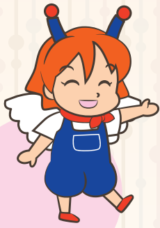
マスコットキャラクター チリン®