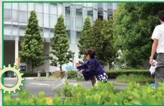
打ち水日和 in INNOVESTA!2019 日中 地面に水をまくと、まわりの 温度が下がって涼しくなるよ！