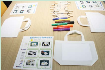
世界で一つのオリジナル エコバッグをつくろう！