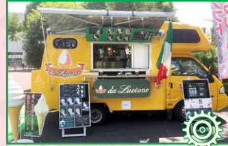
イタリアンジェラート テレコムセンター側(南側) 駐車場 にて販売します。