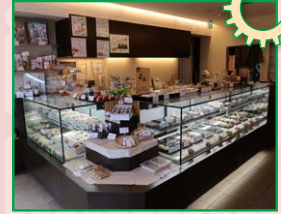
おにぎり・おこわ・お団子 5階飲食スペース(元食堂) にて販売します。 (出展者店舗写真)

イベントに関するお問い合わせは 「INNOVESTA!2019ファミリーデー」 運営事務局まで