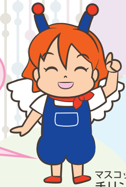
マスコットキャラクター チリン®

工作教室、体験コーナー、 公開展示など、 20 点以上の 楽しいプログラムを用意しています。 くわしい内容は、都産技研ウェブサイトをご 覧ください！ 当日、アンケートにご協力 いただいた方には、素敵な ノベルティをプレゼント！