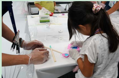
オリジナル入浴剤をつくろう！